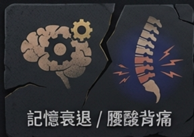
記憶衰退 / 腰酸背痛

許多男人遇到事業瓶頸、家庭失和、甚至走平路都能摔斷腿，總以為是犯太歲。真相極度殘酷：你正在親手抽乾維繫生命最核心的「核能燃料」。