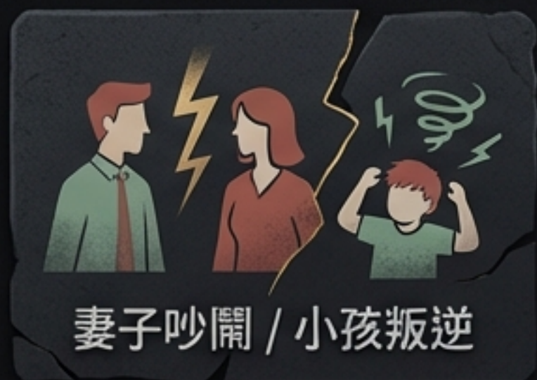
妻子吵鬧 / 小孩叛逆